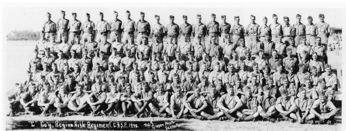
Bron-Regina Rifle Regiment

De geschiedenis van het Regina Rifle Regiment gaat terug naar de tweede helft van de 19 e eeuw. Sociale onrust en opstandige indianen stammen dwingen de regering tot het oprichten van burgerwachten en milities. Het plaatsje Regina richt onder de naam 'Regina Blazers' haar eigen homeguard op ter verdediging tegen de opstandelingen. Het vormt de basis en er wordt gerekruteerd uit de directe omgeving wat een hechte band geeft met de plaats Regina. Met hun Saskatchewan-oorsprong wordt hun bijnaam Farmer Johns. Veel inwoners hebben een boerenbedrijf.